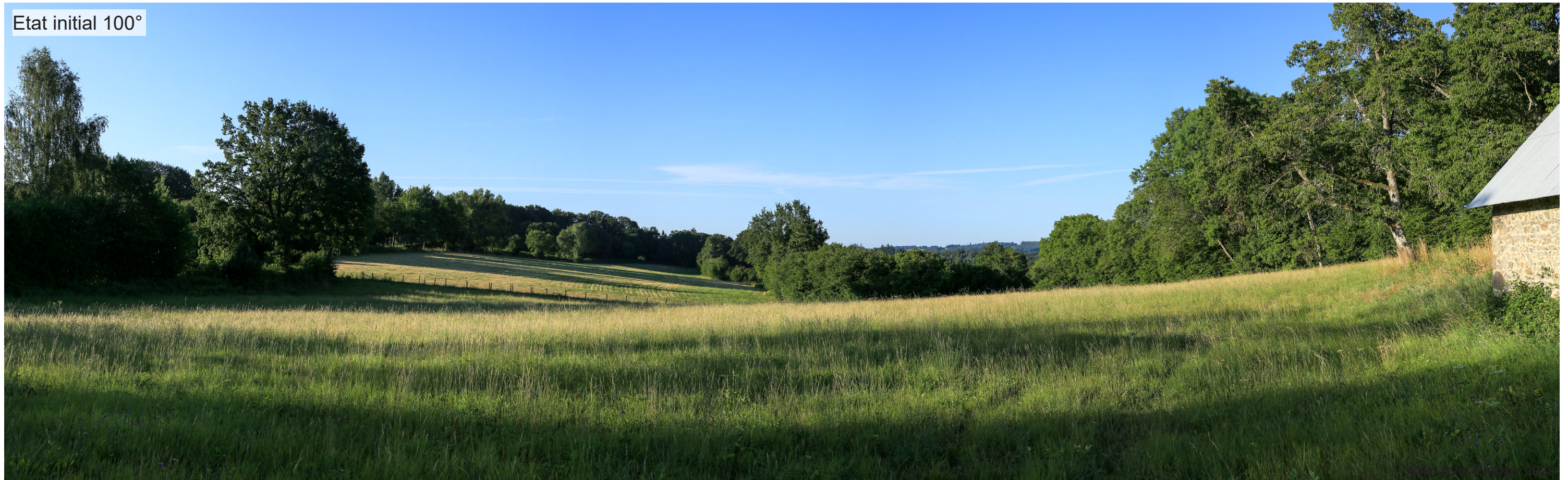
0° 25° 50° 75° 100°