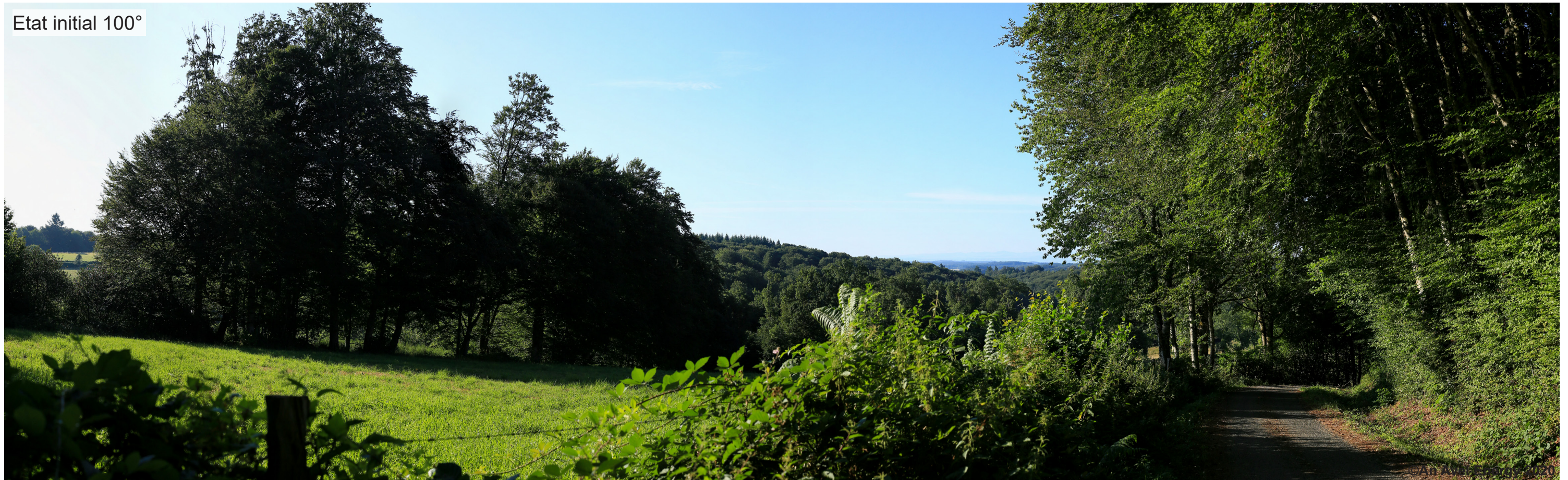
Etat initial 100°